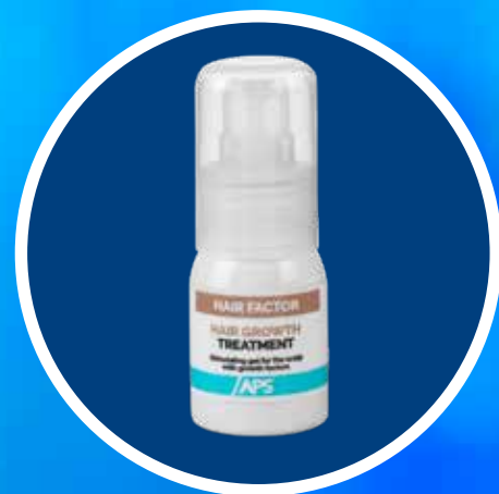
FATTORE DI CRESCITA